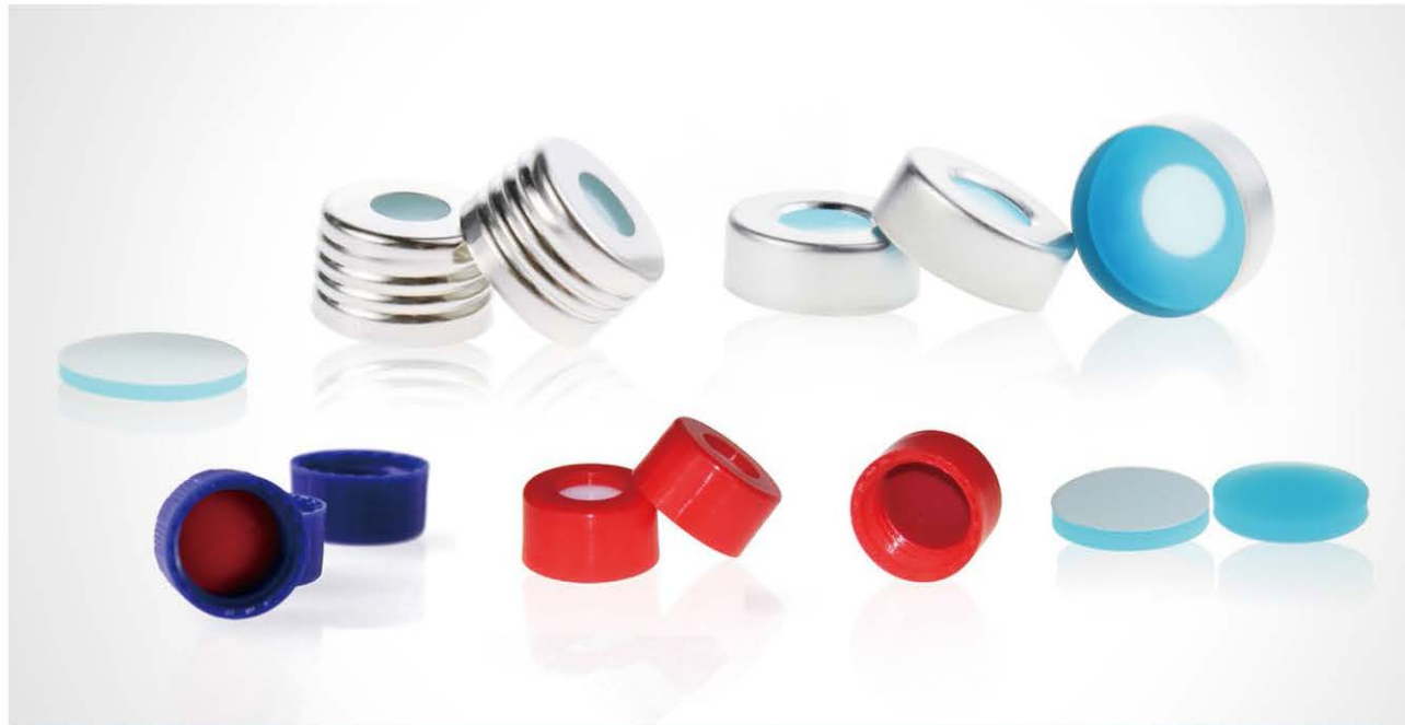
○ 超淨款蓋墊 ○