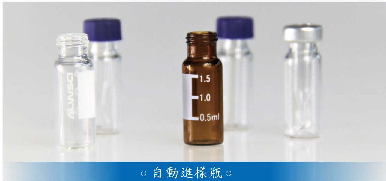
○ 自動進樣瓶 ○

ALWSCI主要提供樣品瓶和色譜耗材，為客戶提供優質，清潔樣品瓶，讓客戶在色譜操作中有更穩定，可靠的樣品。