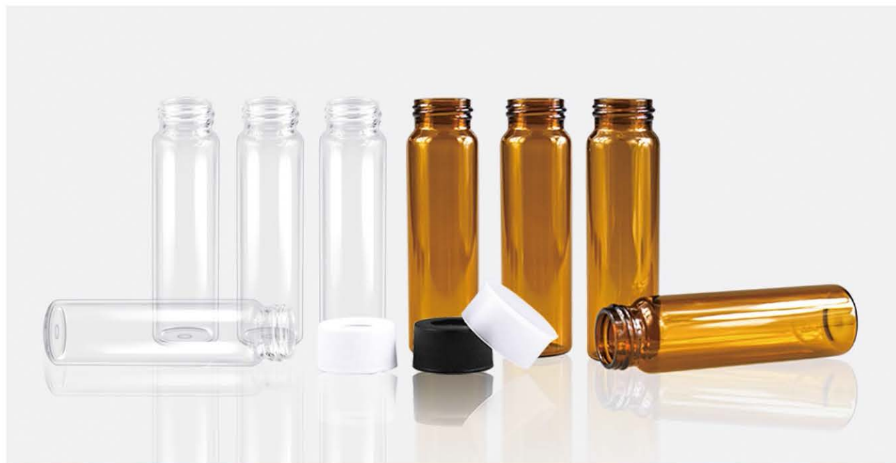
○ 超淨款 ○

歐爾賽斯為讓客戶減少成本，減少時間和法規的壓力，讓客戶能首次就拿到準確的總有機碳(TOC)測試數據，特推出超淨款TOC樣品瓶。